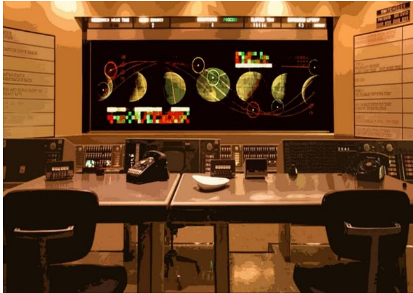
Salle du Self Contrôle -Table de travail

Nous découvrirons le journal de bord du professeur Schmetterling, cosmonaute fortuit devenu par le plus grand des hasards, spécialiste émérite de la chose lunaire . Une toute petite forme théâtrale pour de petits lieux (chez l'habitant, médiathèque, salle de classe, etc...).