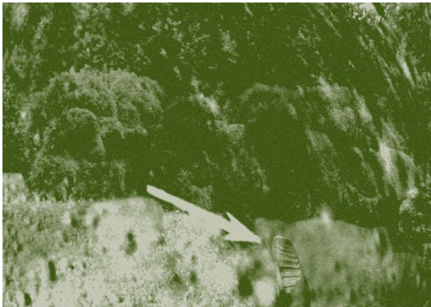
Illustration Laure Guilhot

Pas de grandes envolées musicales. De simples mélodies électro-artisanales, le son du cosmos, probablement des bips ainsi que quelques tuts mais aussi les voix lointaines de cosmonautes, un aboiement de cosmochien , un chant lunien à l'accent géorgien, peut-être un duduk, une guitare, des boîtes à musique en tout genre. Une musique du siècle dernier sans doute bricolée par un geek nonagénaire en direct d'une cave... désuet laboratoire de nos songes lunaires.