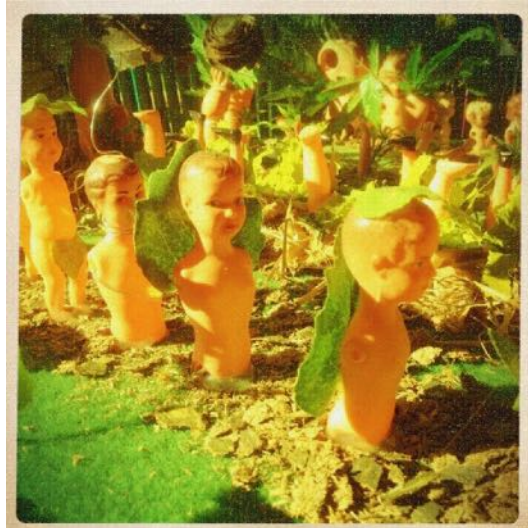
Authentique babynière luniennne.

les couples luniens s'unissent enfin lors de la fameuse lune de miel. Dans la touffeur des plaisirs de la nuit, ils mêlent leurs semences dans un pot de terreau fertile qu'ils déposent ensuite dans un potager collectif appelée babynière ou kindergarten.