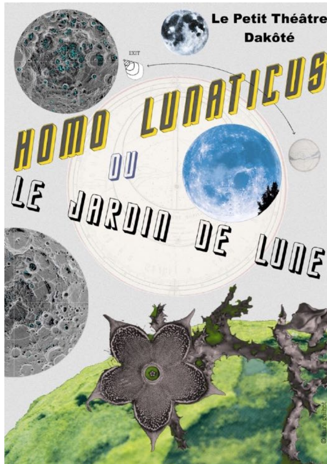
Illustration Laure Guilhot