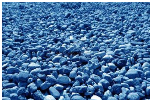
Champ de Pétankôlithes au repos.