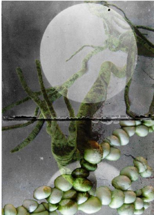
Illustration Laure Guilhot