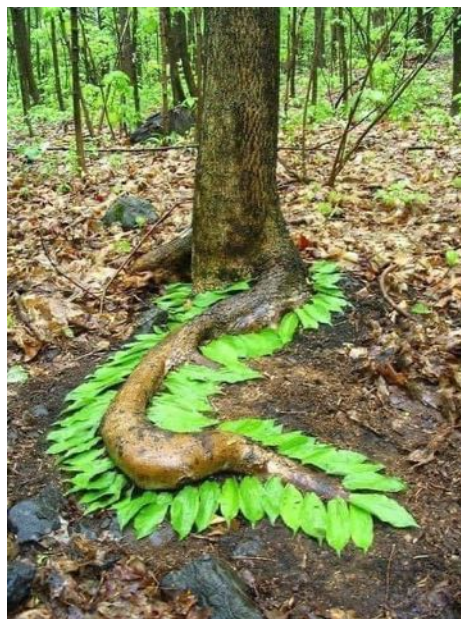
Ninpôteukoi : Serpent-racine à plumes végétales.